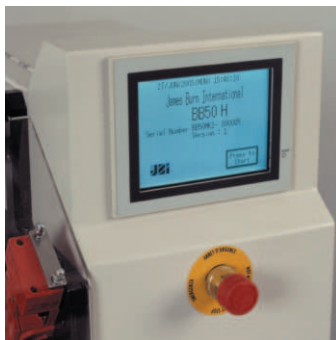
User-friendly control Panel de control táctil de fácil manejo Ecran de contrôle digital facile d'utilisation Benutzerfreundliche Bedienung