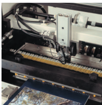
BB50/H Central hanger feed system Dispositivo de colgadores central BB50/H Distributeur de crochets central BB50/H Zentrale Aufhängerzuführung